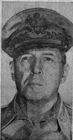
DOUGLAS MAC ARTHUR,

Acaso solamente un general en los Estados Unidos ha sido atacado con flechas y bombarderos.